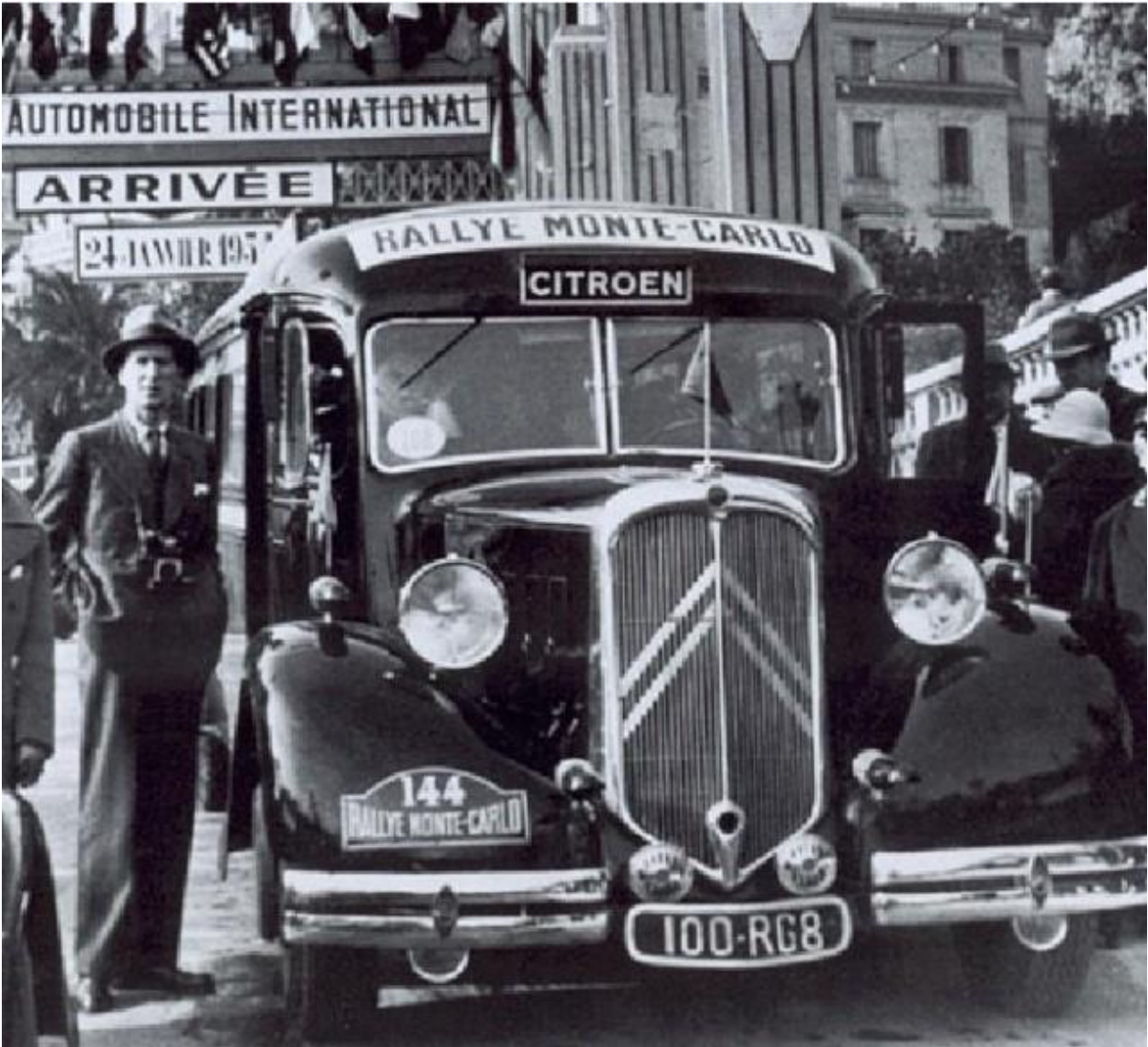
N° 144 Car T45S (S pour Surbaissé) de Lecot, Penot. Couleur bleue