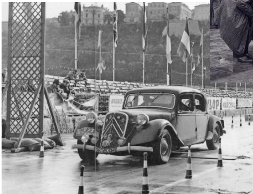
1951 R.Monte Carlo Souly-Puget